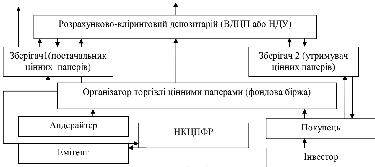
Рис. 2. Залежність депозитарію від діяльності суб'єктів фінансового ринку на прикладі механізму проведення первинного публічного розміщення акцій на фондовому ринку

За даною схемою потрібно відмітити, що при розміщенні акцій, розрахунково-кліринговий депозитарій взаємодіє з іншими учасниками через організатора торгівлі цінними паперами, а саме фондову біржу. Даний елемент є організаційно оформленим ринком, на якому безпосередньо виникають умови для вільної купівлі-продажу цінних паперів на регулярній та впорядкованій основі.